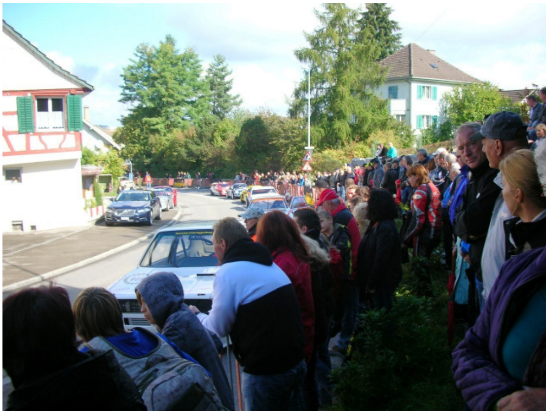
Viele Zuschauer am Vorstart