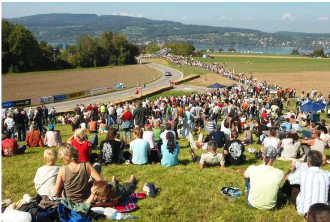
Am Sonntag geniessen die Zuschauer das sonnige Wetter