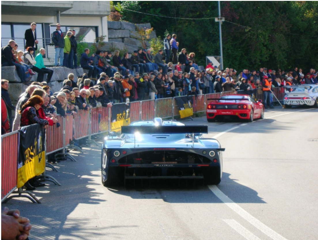
Die Kategorie „Sportwagen“ am Start