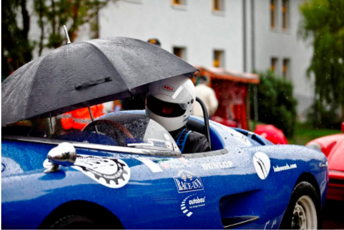
Wer kein „Hüusli-Auto“ hat wird auch nass