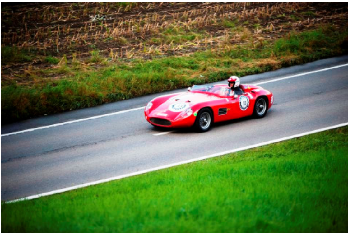
Barchetta Tipo 61, 4500 ccm, 180 PS