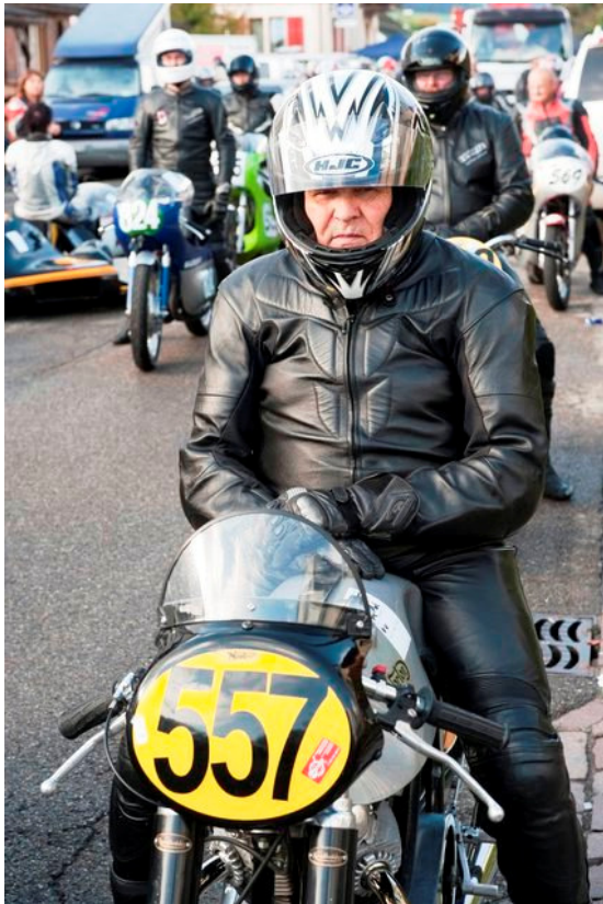
Die FRM'ler warten auf den Start